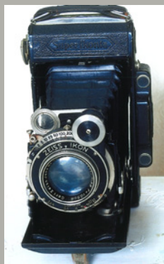
《スーパーセミコンタ》 1934