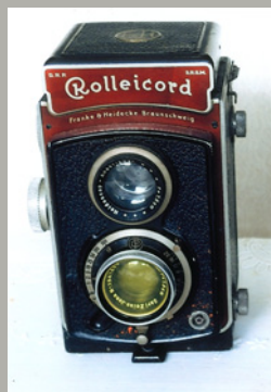
《ローライフレックス・スタンダード》1982