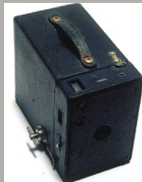
《ライトニングマガジンカメラ》 1899