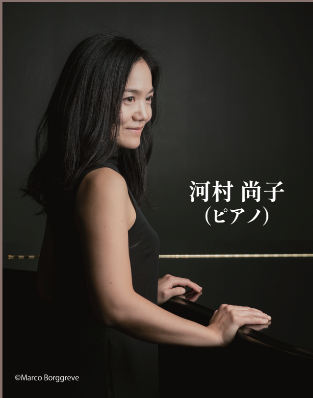
河村 尚子 (ピアノ)